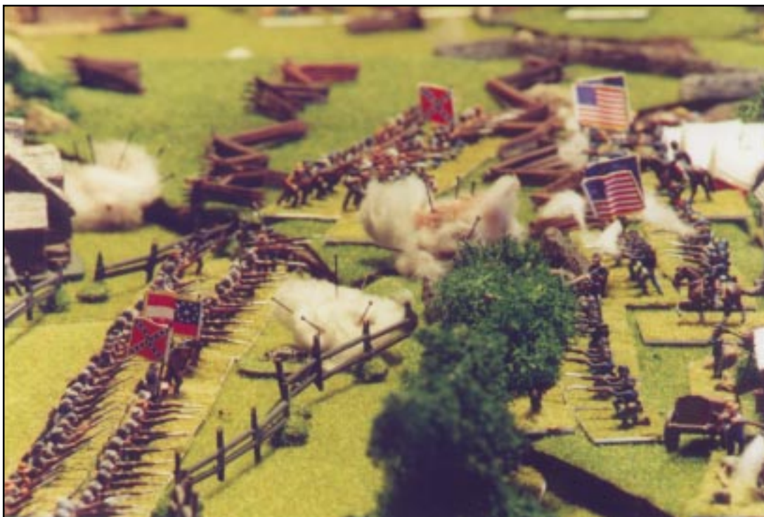
Slaget vid Gettysburg den 1–3 juli 1863. Picketts stora anfall mot nordstatsarméns center har precis inletts.